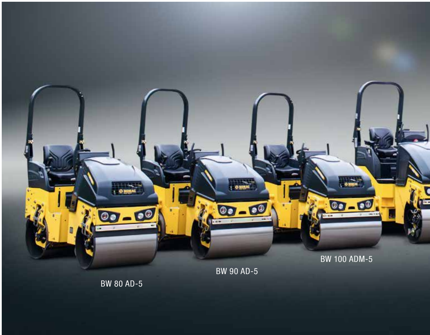
BW 80 AD-5