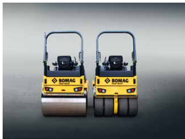
BW 135/138: Die Schwersen von 3,9 bis 4,3 t.