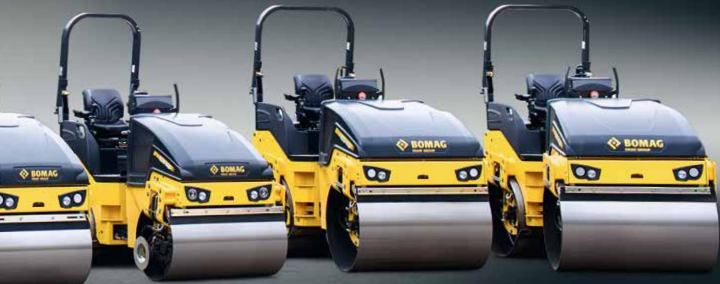
BW 100 AD-5