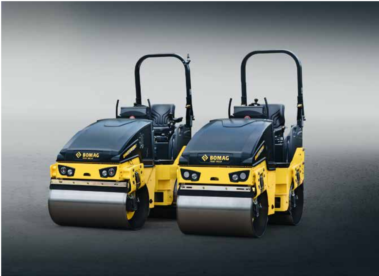
BW 100/120: Die Universellen von 2,3 bis 2,7 t.

BOMAG bietet Ihnen für jede Anwendung die passende Maschine. Wählen Sie aus 14 unterschiedlichen Modellen genau die Walze und die Ausstattung, die am besten zu Ihnen, Ihren Aufgaben und Ihrem Betrieb passt.