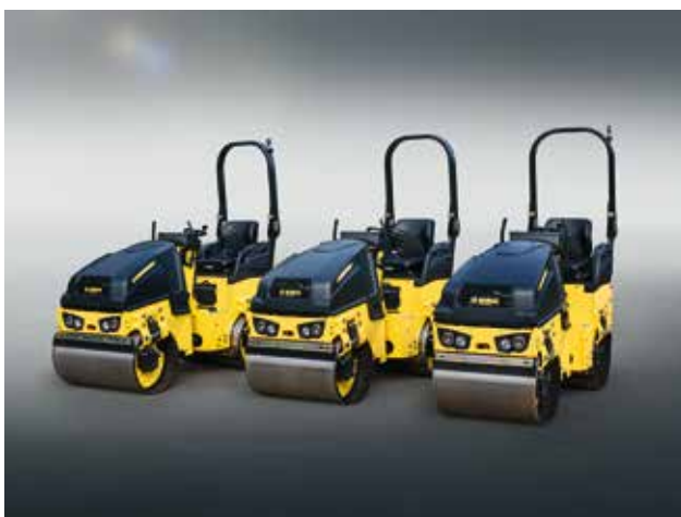
BW 80/90/100: Die Leichten bis 1,8 t.